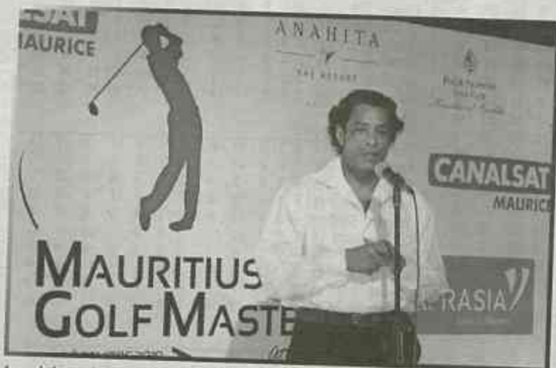
Le ministre du Tourisme, Nafidó Bodha, a félicité Anahita pour son initiative.